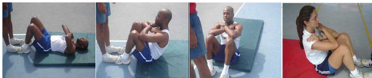
Figura 02: Flexão do tronco sobre as coxas para os sexos masculino e feminino

f) retirar ou arrastar o quadril do solo durante a execução do exercício.